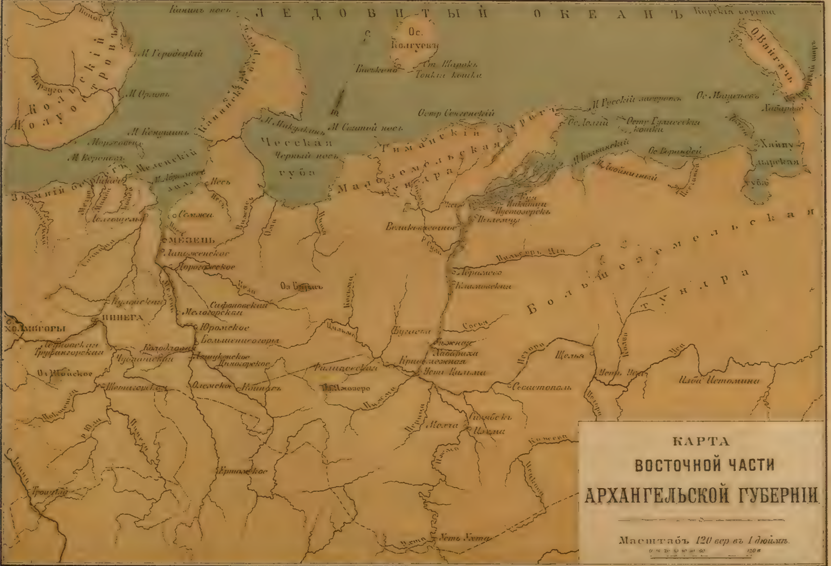
КАРТА ВОСТОЧНОЙ ЧАСТИ АРХАНГЕЛЬСКОЙ ГУБЕРНИИ Масштабъ 120 вер в 1 дюймъ. 120 в